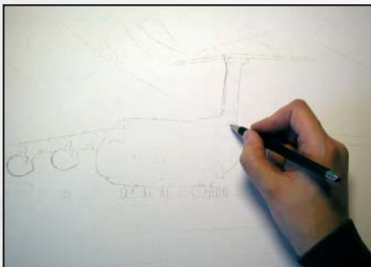
Die Konturzeichnung wird übertragen